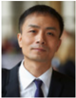
Michael Anti Chinese Blogger Unconventional War