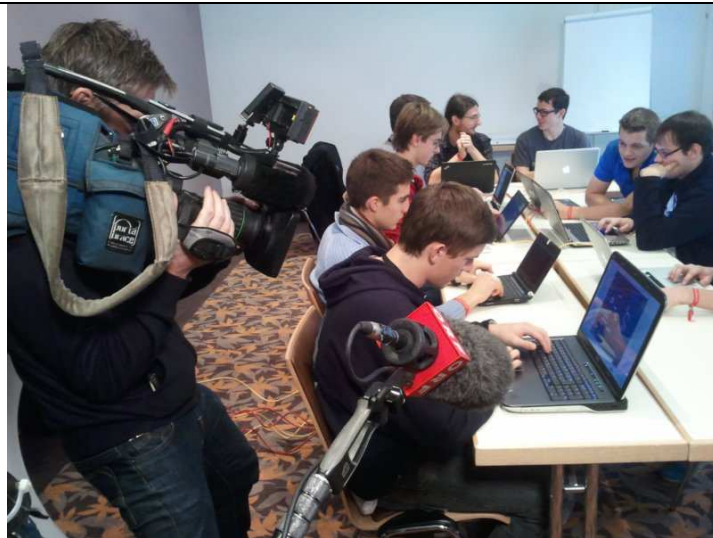
Österreichische Finalisten 2012 bei der Arbeit

Die folgenden Impressionen geben einen Eindruck von der vergangenen Cyber Challenge im Jahr 2012.